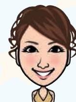
麗 rei 3月30日 32歳 ?型